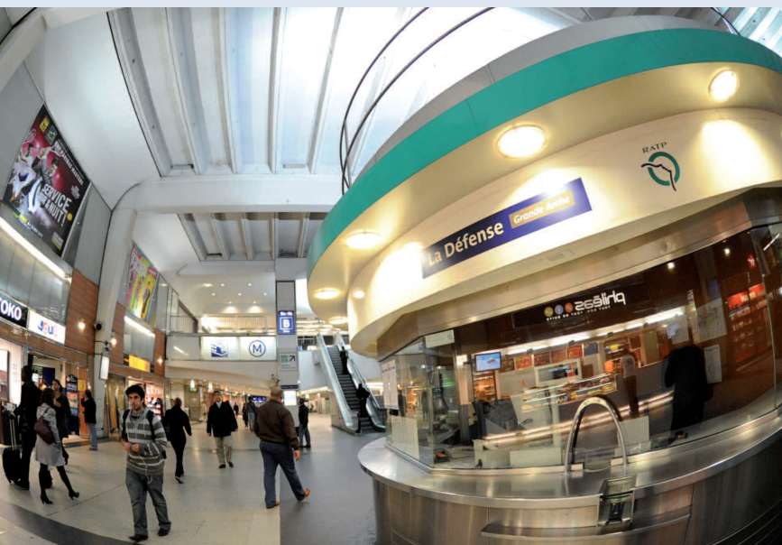
Le hub de La Défense

De nouveaux services y seront développés pour les habitants et les usagers en complémentarité avec ceux déjà proposés par le tissu de commerçants et d'artisans de proximité.